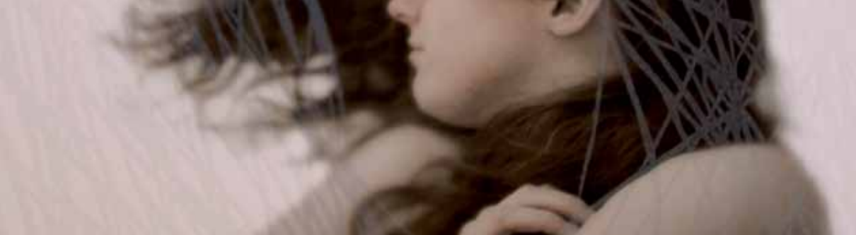
Eva Santín • Detalle. Thought II . Xilografía sobre impresión digital y perforaciones, 2010