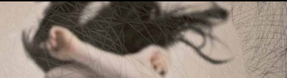
Eva Santín • Detalle. Intimacy III • Xilografía sobre impresión digital, 2009