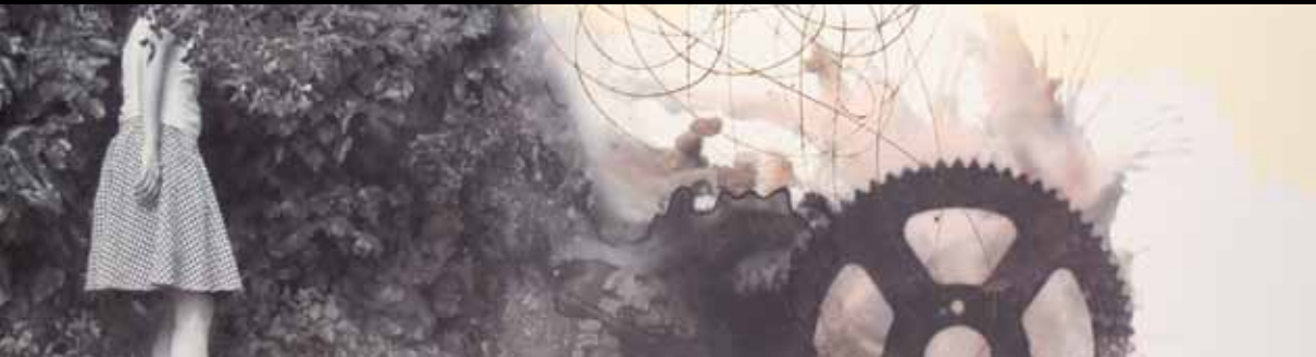
Helena Losada • Detalle. Alicia...I • Xilografía, punta seca, impresión digital y sombras proyectadas, 2011