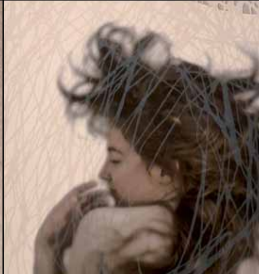
Detalles. Durmiente I, Intimacy IV, Thought I • Xilografía sobre impresión digital y perforaciones, 2009-2010