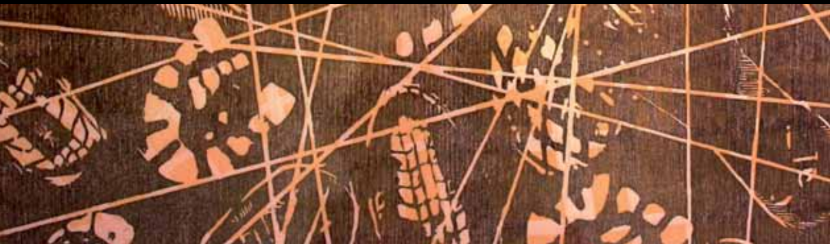
Sara González • Detalle. Chaos • Xilografía, 2010