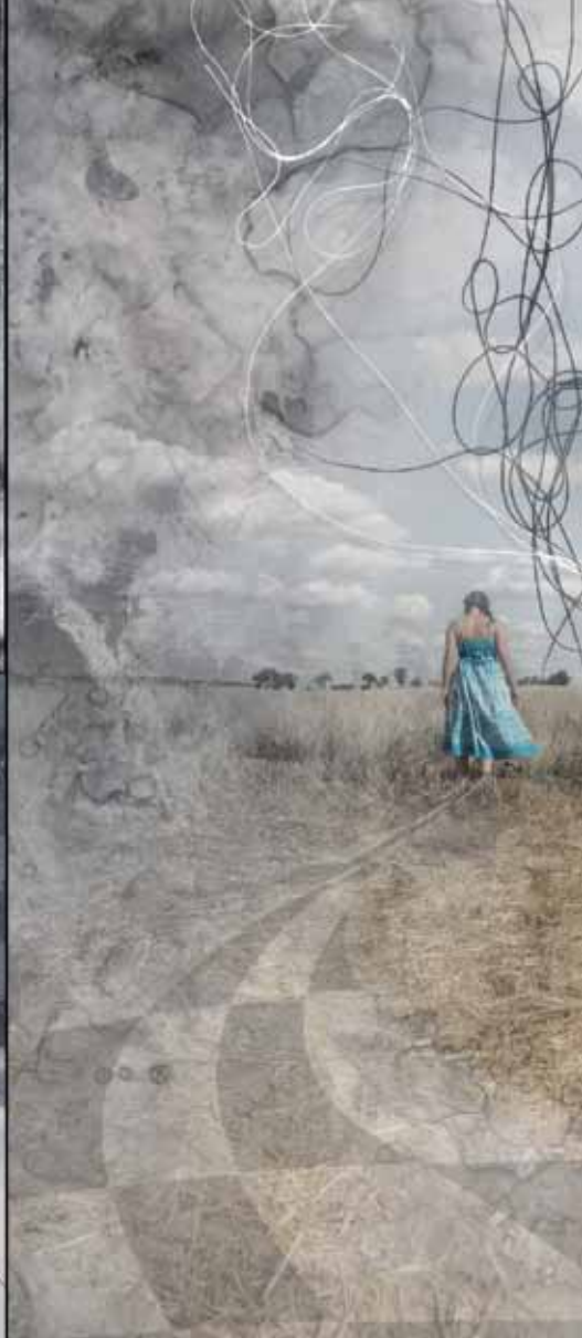
Serie Once upon a time... • Xilografía, impresión digital, punta seca y sombras proyectadas, 2011