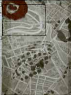
Detalles. No way, finding ways, obra gráfica, 2010 | Detalle. Página de libro de artista , collage, 2010