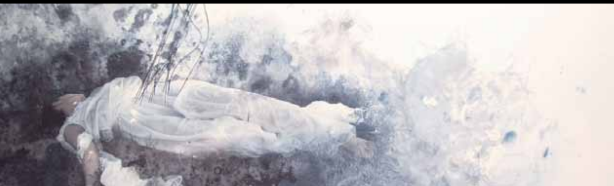
Helena Losada • Detalle. Cien años de sueño... • Xilografía sobre impresión digital, 2011