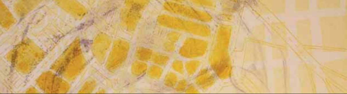
Sara González • Detalle. Perdidamente • Aguafuerte, lavis y xilografía, 2011